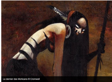
Le dernier des Mohicans