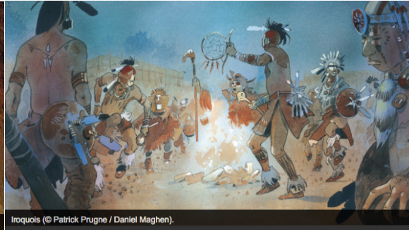
Iroquois.